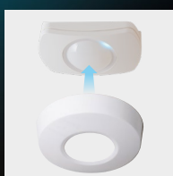
Proteção para instalação no teto