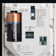
Configuração automática sem fios