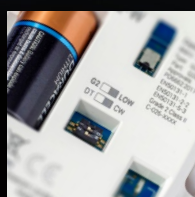
Instruções gravadas a laser