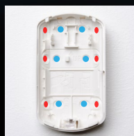
Punti di montaggio flessibili