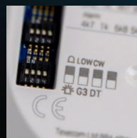
Modalità CloakWise e Dual Tech selezionabili