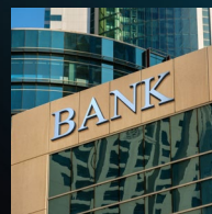
Bancario e finanzia

I rilevatori di movimento Capture offrono prestazioni eccellenti in un'ampia gamma di applicazioni di sicurezza professionali.