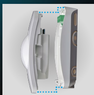
Componenti elettronici con caricamento anteriore