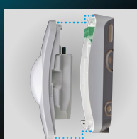
Frontlæsset fuldt forseglet elektronik