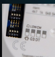
Vælgbar CloakWise og dobbelt teknologi-tilstande