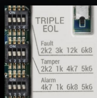
Indbygget EOL modstande